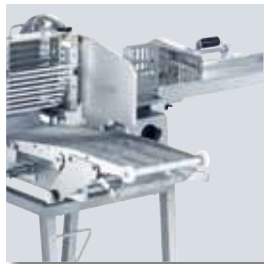
VA 806 FB con cinta transportadora corta 690 mm

CARRO PARA 600 MM DE LONGITUD DE SUJECCIÓN CON CINTA TRANSPORTADORA